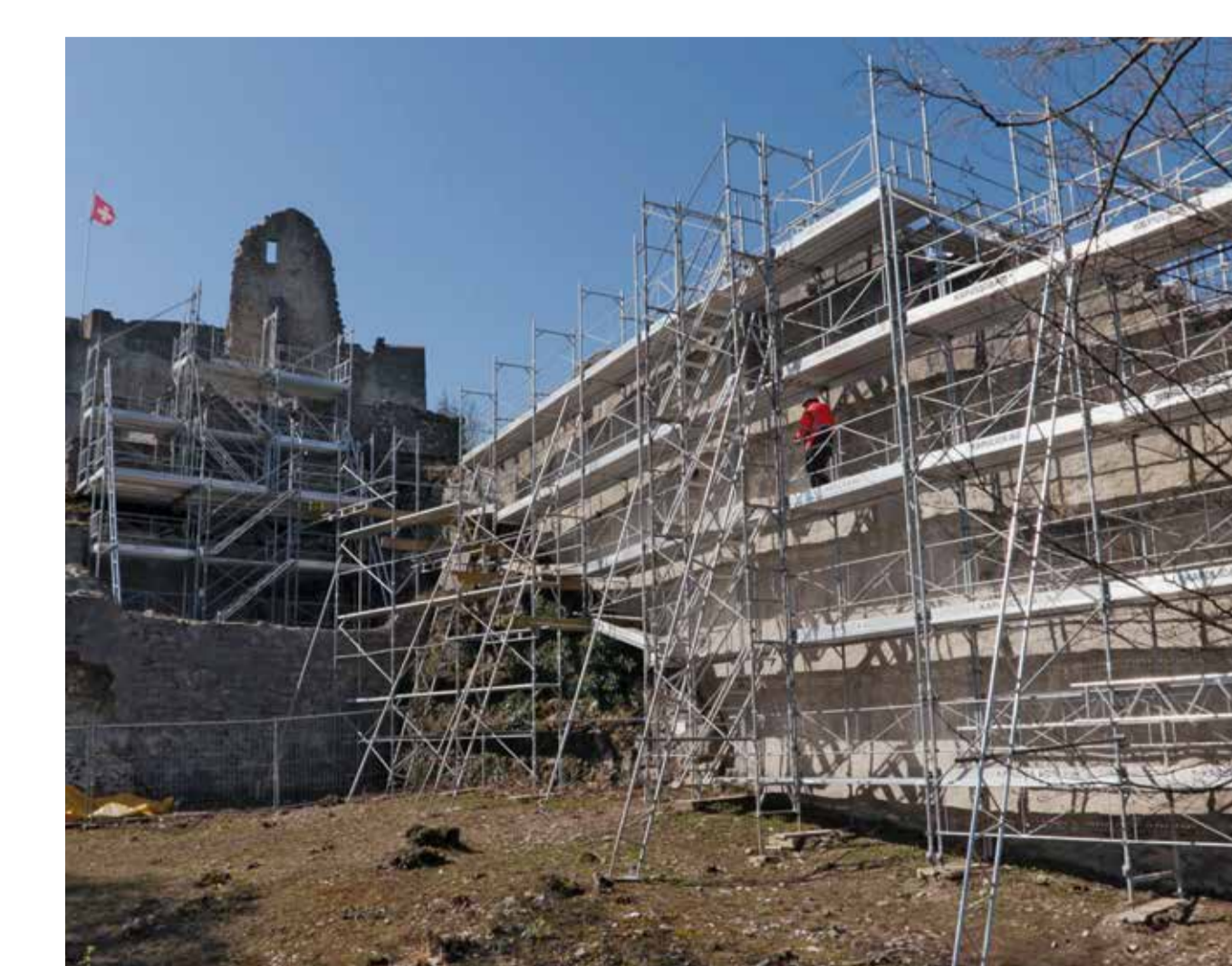
Die Sanierungsarbeiten an der Farnsburg begannen im Frühjahr 2020 mit dem Eingerüsten der Unterburg.