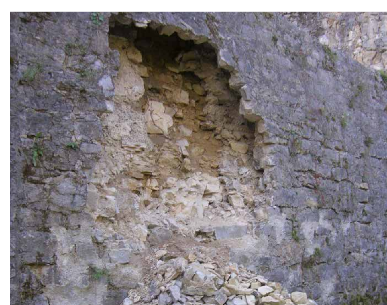
Grosser Ausbruch in der Mauerachse. Die Schäden werden vor allem durch eindringendes Wasser verursacht, das im Winter gefriert und die Schale wegsprengt. Ein Ziel der Sanierung ist deshalb die Abdichtung der Mauern.