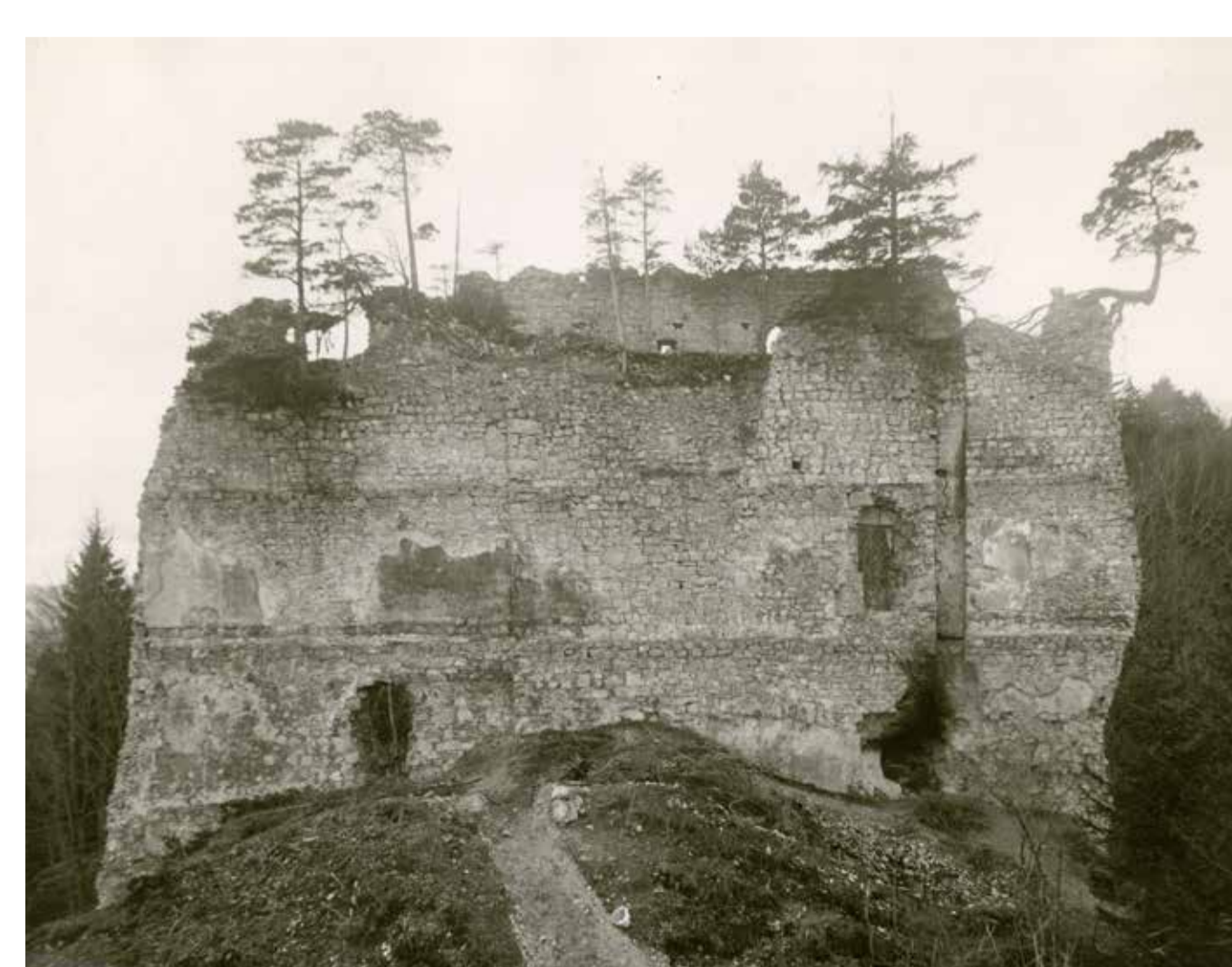
Die Schildmauer vor ihrer ersten Konservierung im Jahr 1930. Obwohl der schleichende Zerfall nach 1798 der Mauer stark zusetzte, hat das gewaltige Bauwerk kaum von seiner machtvollen, trutzigen Art verloren.